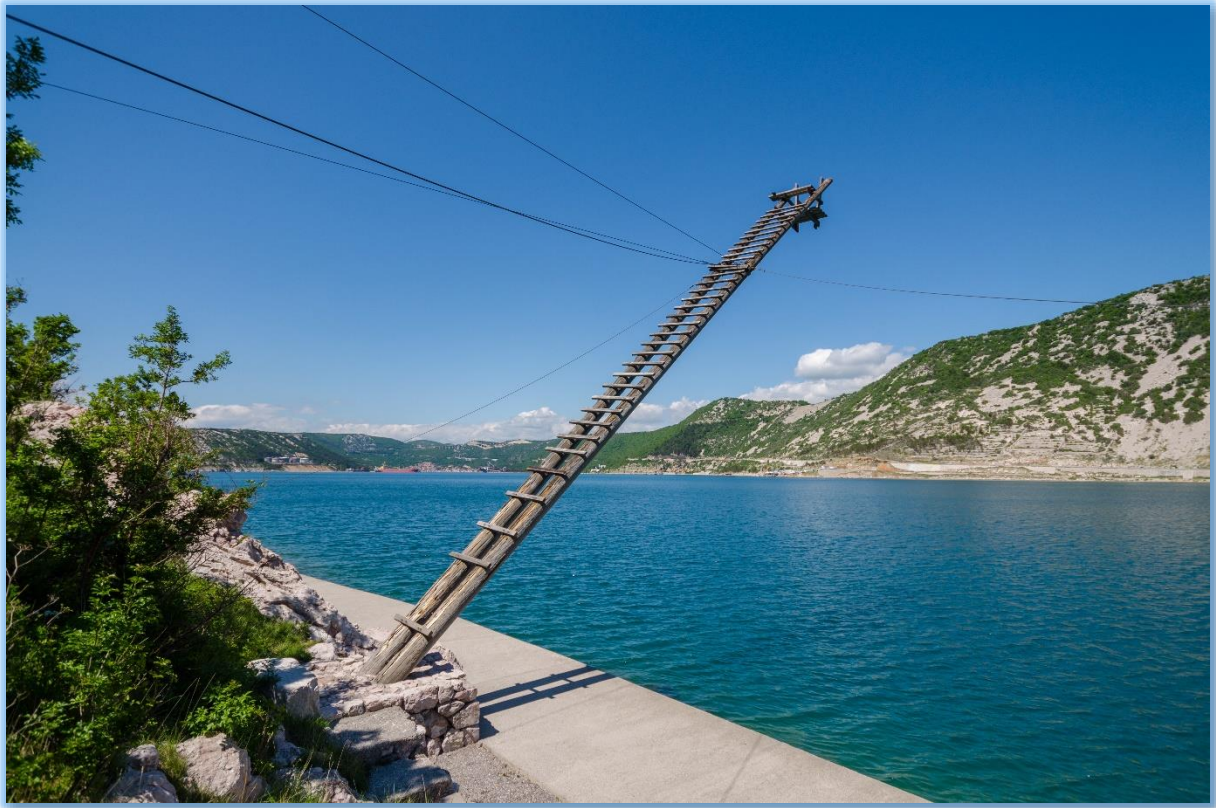
Slika 2. Tunera u Jadranovu (Grad Crikvenica)